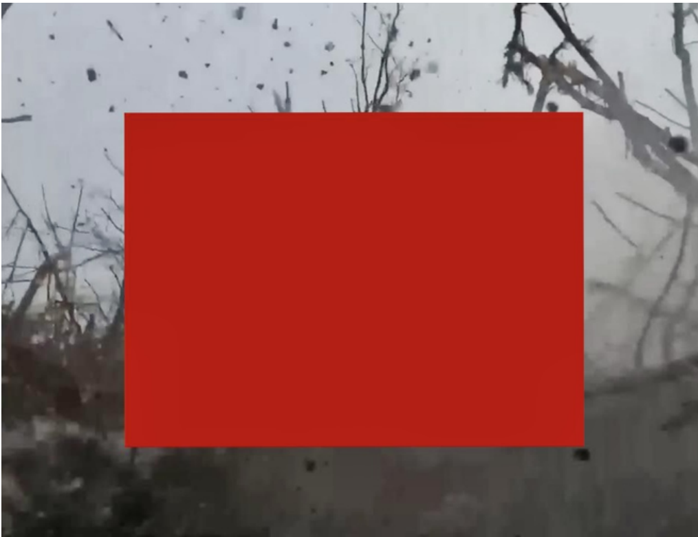
Guerras que no han tenido lugar, Claudio Zulian, 2023