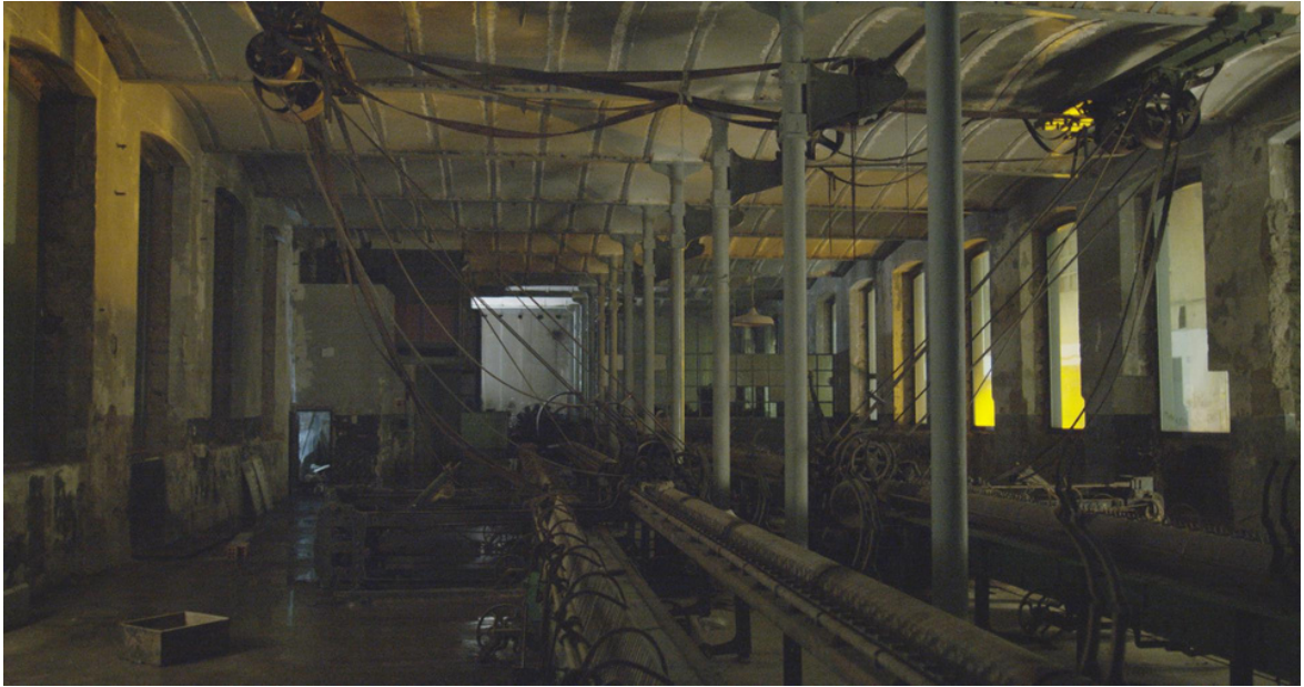
La fábrica , Claudio Zulian, 2019